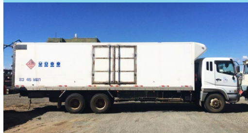
Даац 18 тн