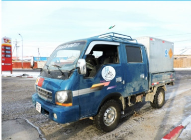
Даац 1 тн