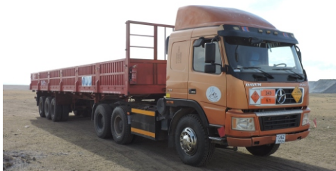
Даац 35 тн