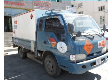
Даац 2 тн