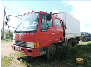
Даац 8 тн